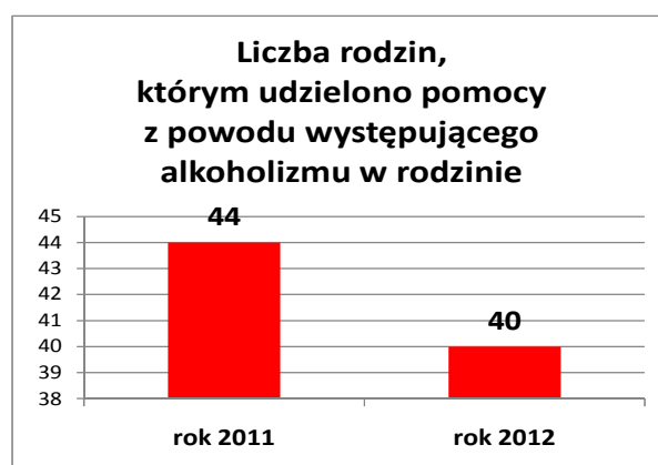
Wykres Nr 2

Ważne miejsce należy również przypisać poradnictwu specjalistycznemu oraz działaniom Zespołu Interdyscyplinarnego.